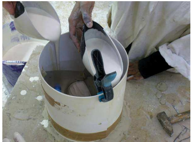
4/ Le coulage du plâtre reste toujours délicat pour ne pas déformer les radios, ou pire, les voir sortir de leurs emplacements. Idéal, couler sur un pont à cheval sur les radios (Λ).