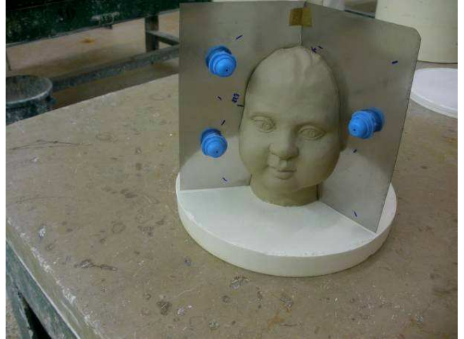
2/ Le modèle est placé sur une base d'appui savonnée pour faciliter le coffrage.