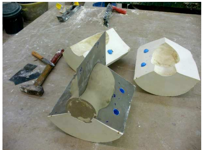
6/ Après la prise du plâtre, ouvrir le moule en insérant la lame d'un couteau au marteau entre les parties (le modèle humide colle ± au moule).