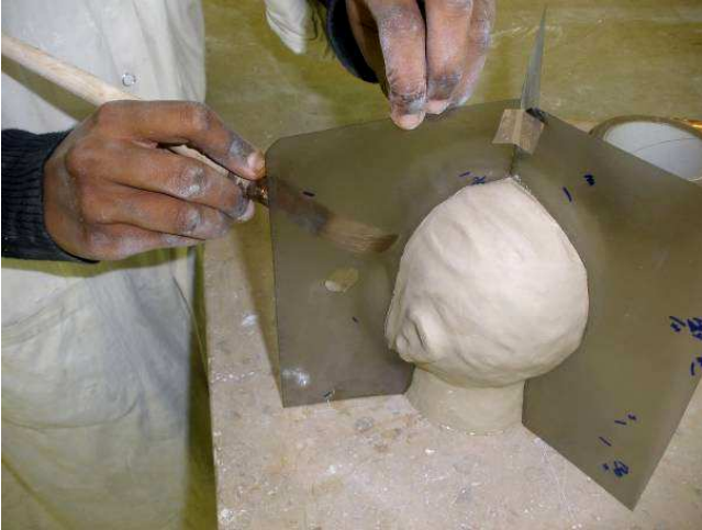
1/ Les radios taillées à la dimension du futur moule sont très légèrement huilées.