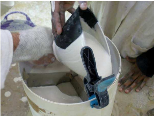
5/ Le plâtre est réparti dans les différents compartiments pour équilibrer les forces.