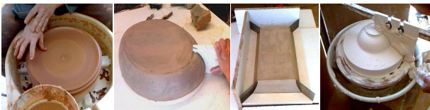
Maison/Céramique : autour de l'estampage, avril 2010

L'association du matériau terre avec la technique de travail du plâtre permet d'éliminer les deux aspects difficiles : le matériau plâtre et la technique terre.